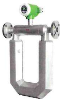
Стандартное исполнение счетчика-расходомера от DN 25 до DN 300