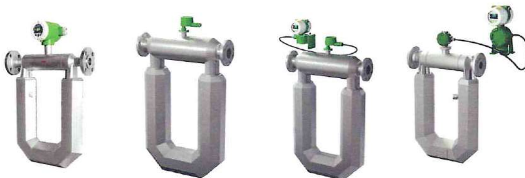
Интегральное исполнение счетчика-расходомера

Заводской номер счетчика-расходомера наносится на маркировочной табличке первичного преобразователя и маркировочной таблички электронного блока фотолитографии и полиграфическим способом в буквенно-числовом формате. Места нанесения знака утверждения типа и заводского номера показаны на рисунке 3.