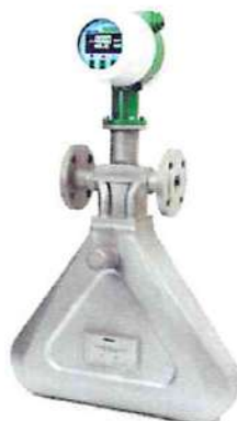
Стандартное исполнение счетчика-расходомера от DN 10 до DN 15