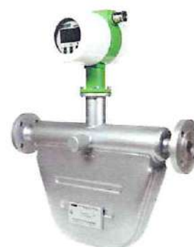
Компактное исполнение счетчика-расходомера от DN 5 до DN 300