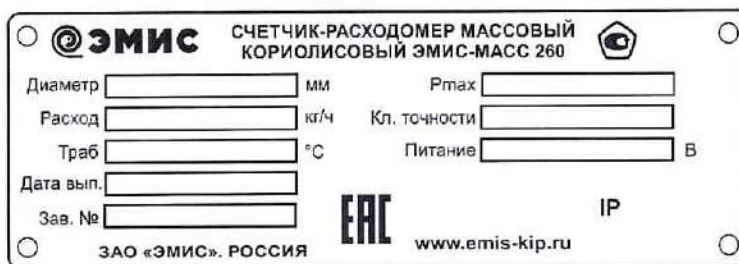
Рисунок 3 – Пример маркировочной таблички